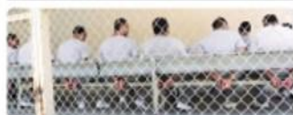
TIJUANA. Desde hoy la Secretaría de Salud del Estado iniciará la vacunación Covid-19 al personal de los Centros de Reinserción Social (Ceresos) del Sistema Penitenciario de Baja California.