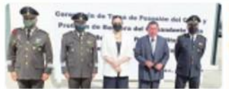
TIJUANA. El fiscal se coordinará permanentemente con la Guardia Nacional, y las autoridades federales.