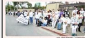
TIJUANA. Líderes clubafanos señalan que los candidatos aprovechan la protesta para sacar raja política.

TIJUANA. Con una pobre asistencia que no superó las 300 personas, la manifestación contra la expropiación del Club Campestre se redujo a un acto de oportunismo político, debido a que se contaminó con la presencia de los candidatos de la alianza Ya por Baja California (PAN-PRI-PRD).